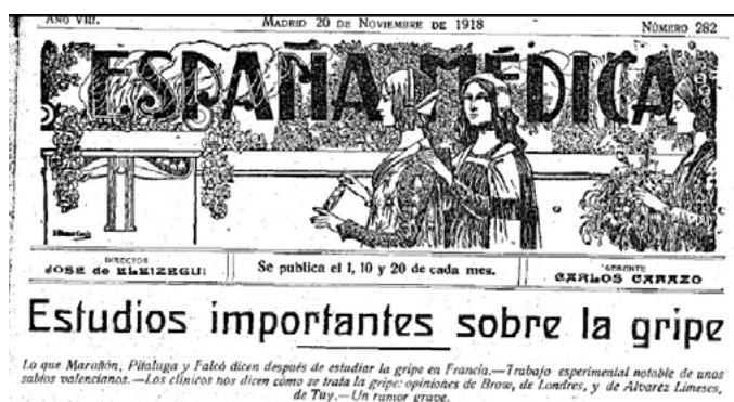
Figura 5. Portada de la revista España Médica

Fue un hombre bueno y generoso. Se le conoció en Tui como el médico de los pobres.