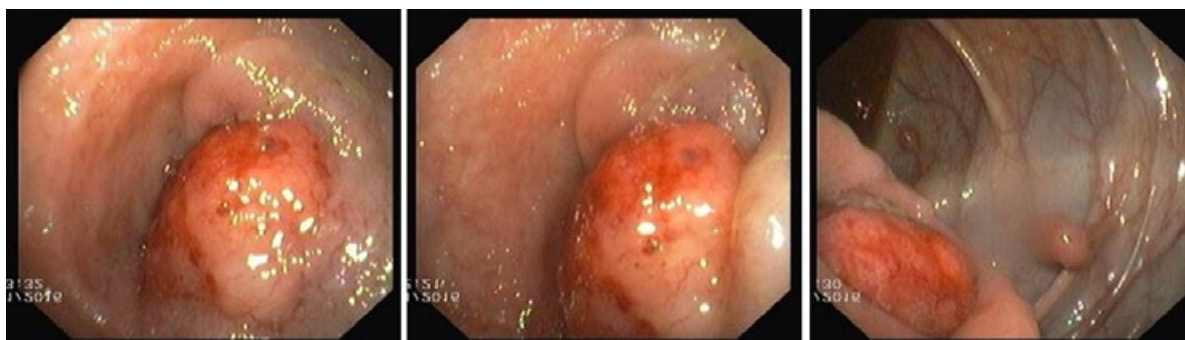
Figura 3. Imagem da colonoscopia a revelar lesão polipóide e infiltrativa com cerca de 40mm na transição íleo-cecal.