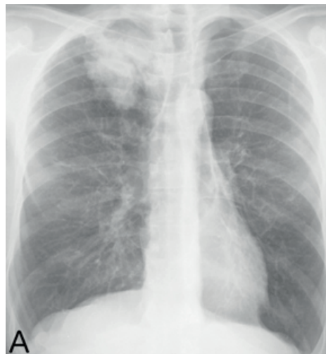
Figura 2. Radiografia torácica 1 ano depois, com opacidade ocupando agora todo o lobo superior do pulmão direito.