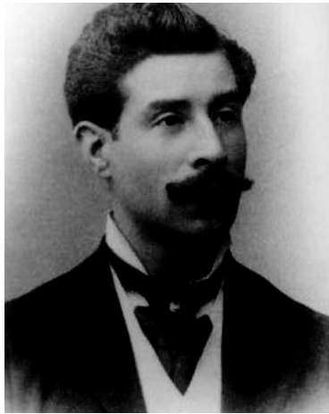
Figura 1. Ovidio Murguía Castro