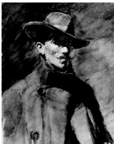
Figura 3. Jenaro Carrero. Autorretrato