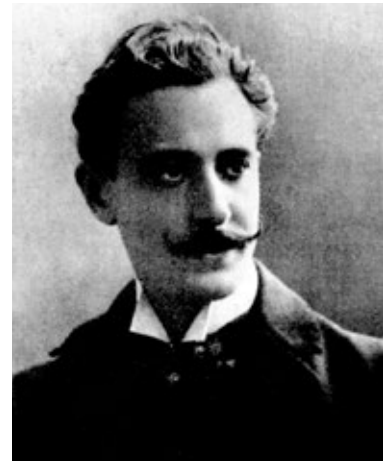
Figura 5. Joaquin Vaamonde Cornide, 1897.