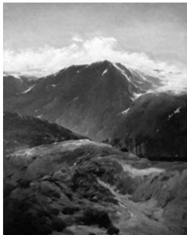
Figura 2. Ovidio Murguía. Guadarrama (1898)