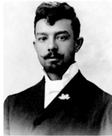
Figura 4. Ramón Parada Justel [Public domain], via Wikimedia Commons